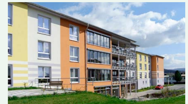
Das Senioren-Servicehaus Waldershof

Das Senioren-Servicehaus Waldershof lädt zu einem Gesundheitstag und einem Tag der offenen Tür ein. Dabei werden den interessierten Besuchern viele Informationen zum Thema Gesundheit, wie auch zum Senioren-Servicehaus in Waldershof präsentiert. Wir werden unterstützt vom Rehateam, der GHDr, der Stadtapotheke Waldershof, dem Hospizverein, dem Sozialteam PflegeMobil und durch Optiker Wagner. Neben dem vielfältigen Programm werden zwei Vorträge stattfinden: Um 14:30 Uhr wird das Rehateam über die Verordnung von Hilfsmitteln und den Widerspruch bei den Krankenkassen referieren. Um 15:30 Uhr berichtet Frau