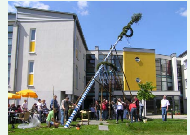
Maibaumaufstellen im Senioren-Servicehaus Fuchsmühl

Sie sind herzlich eingeladen. Wir freuen uns auf Sie!