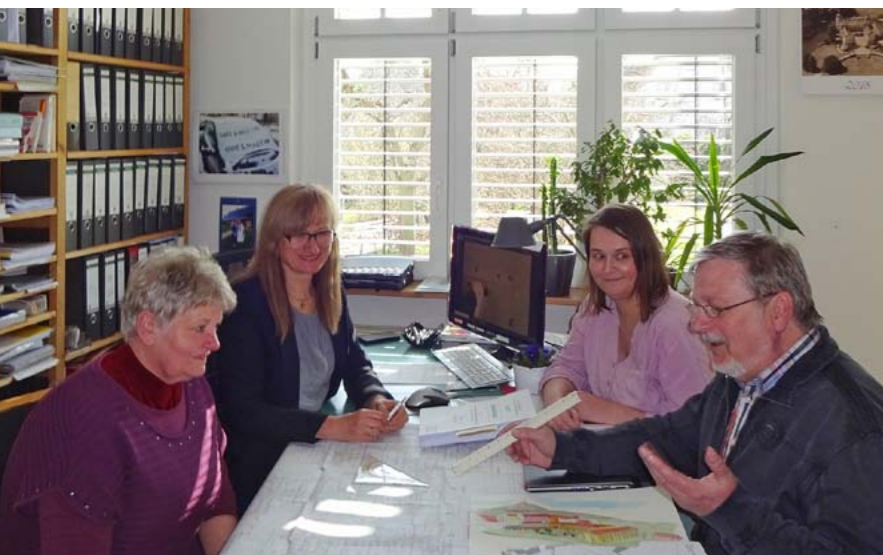
Team der Planungsgruppe Petrick GmbH

Im neuen Baugebiet „Am Viehhof“ in Parkstein entsteht ein zukunftsweisendes Wohn-, Betreuungs- und Pflegeprojekt für Seniorinnen und Senioren – das Sozialteam Senioren-Servicehaus Parkstein. Damit wird ein Stück Zukunft für den Markt Parkstein realisiert.