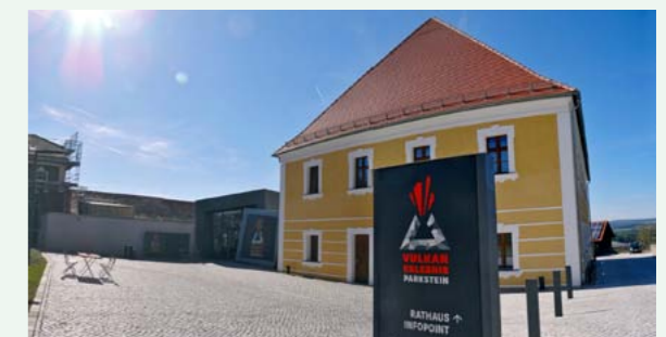
Rathaus im Landrichterschloss Parkstein

Im Rahmen der Eröffnung des alten Landrichterschlosses stehen MitarbeiterInnen von immoproject und Sozialteam für Informationen zum geplanten Sozialteam Senioren-Servicehaus Parkstein zur Verfügung. Im Bürgertreff des „Benefiziums“ können Sie aktuelle Informationen rund um den Bau des Senioren-Servicehauses, den Kauf von Apartments, aber auch Informationen über unser Versorgungs- und Betreuungskonzept einholen. Ebenso besteht